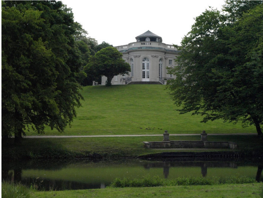
Blick auf das Schösschen Richmond in Braunschweig (1769 - 1774 für Prinzessin Augusta errichtet). Entwurf des Parks: Lancelot „Capability“ Brown. Die Anlage gilt zusammen mit Wörlitz als einer der ersten Englischen Landschaftsparks auf dem Kontinent.

In Braunschweig (und ebenso in Wolfenbüttel) wurde die Oker zu Verteidigungszwecken um die Altstadt herumgelegt. Das Verteidigungssystem in Braunschweig bestand aus der äußeren Umflut sowie aus innerhalb der Wälle verlaufenden Gräben, dem Neustadtmühlen- und dem Wendenmühlengraben. Kurz nachdem die Festungsanlagen in Braunschweig im 18. Jh. fertiggestellt waren, waren sie schon militärisch obsolet. Anfang des 19. Jh. wurden sie geschleift und in eine ringförmig die Altstadt umgebende Wallanlage umgewandelt. Dieser geschlossene Grüngürtel ist ein wichtiges Herausstellungsmerkmal für die Lebensqualität in Braunschweig. Seine galeriewaldartigen Bestände werden derzeit in einem Forschungsprojekt untersucht, wobei sich Ähnlichkeiten zu sog. Burgenwäldern abzeichnen.