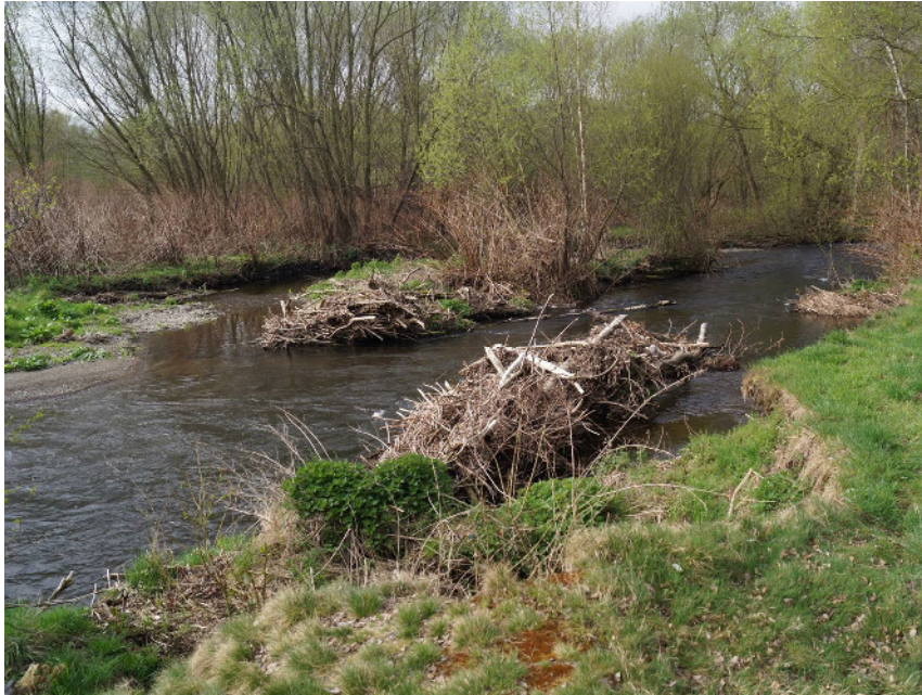
Dietmar Brandes: Oker im nördlichen Steinfeld

Entlang der Oker gab es zahlreiche Burgen und befestigte Plätze, als frühestes Beispiel wird die sog. Schwedenschanze bei Isingerode zwischen Schladen und Hornburg als bronzezeitliche befestigte Anlage eingestuft. Während die Höhenburgen im Okertal und auf dem Sudmerberg völlig abgegangen sind, sind im Harzvorland Vienenburg und die Wasserburg Wiedelah noch erhalten. Von der bereits 1291 geschleiften Harliburg finden sich wenigstens noch Fundamentreste und Gräben. In diesem Zusammenhang muss die Königspfalz Werla unbedingt genannt werden. Auf einem Ufersporn auf der Okerterrasse im 9. Jh. angelegt, entwickelte sie sich im 10. Jh. zu einem wichtigen Stützpunkt der Ottonen. Spätestens im 14. Jh. fiel die Anlage jedoch wüst. Mit einer Fläche von ca. 20 ha ist sie das flächengrößte Bodendenkmal Norddeutschlands. Im weiteren Okerverlauf gab es mindestens 11 weitere Wasserburgen, von denen nur das Schloss Wolfenbüttel (aus einer Wasserburg entstanden) und die Burg Dankwarderode in Braunschweig in stark veränderter Form erhalten sind.