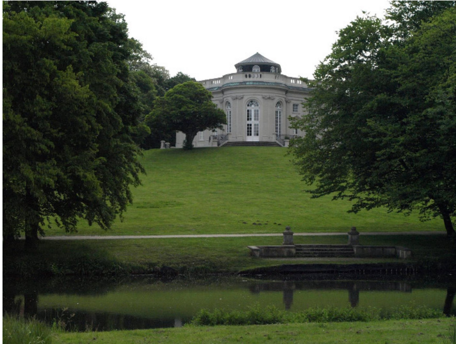
Blick auf das Schlösschen Richmond in Braunschweig (1769 - 1774 für Prinzessin Augusta errichtet). Entwurf des Parks: Lancelot „Capability“ Brown. Die Anlage gilt zusammen mit Wörlitz als einer der ersten Englischen Landschaftsparks auf dem Kontinent.

In Braunschweig (und ebenso in Wolfenbüttel) wurde die Oker zu Verteidigungszwecken um die Altstadt herumgelegt. Das Verteidigungssystem in Braunschweig bestand aus der äußeren Umflut sowie aus innerhalb der Wälle verlaufenden Gräben, dem Neustadtmühlen- und dem Wendenmühlengraben. Kurz nachdem die Festungsanlagen in Braunschweig im 18. Jh. fertiggestellt waren, waren sie schon militärisch obsolet. Anfang des 19. Jh. wurden sie geschleift und in eine ringförmig die Altstadt umgebende Wallanlage umgewandelt. Dieser geschlossene Grüngürtel ist ein wichtiges Herausstellungsmerkmal für die Lebensqualität in Braunschweig. Seine galeriewaldartigen Bestände werden derzeit in einem Forschungsprojekt untersucht, wobei sich Ähnlichkeiten zu sog. Burgenwäldern abzeichnen.