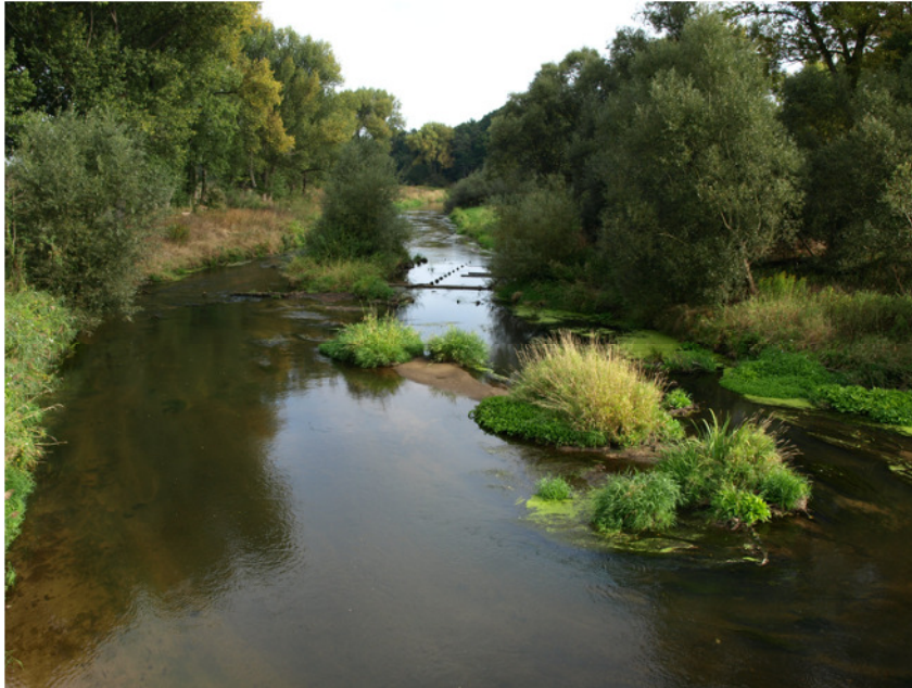
Dietmar Brandes: Oker bei Neubrück